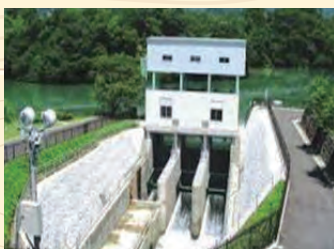
兼山取水口(八百津町)