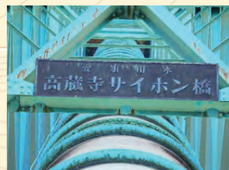
高蔵寺サイホン橋の辺りを散策予定です。