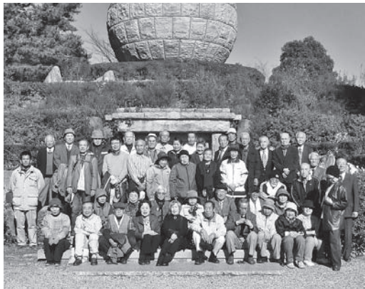
除幕式に参加された皆様