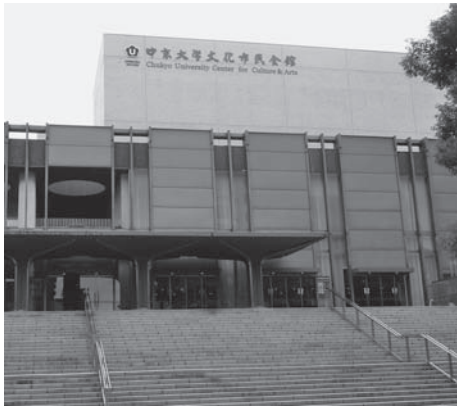
開場前長蛇の列となった中京大学文化市民会館

開会に先立ち不老会創立の原点となった愛知用水事業のドキュメンタリービデオが上映され、過去の水不足から今日の繁栄に至る足跡をかいま見て皆様にも感動して頂きました。