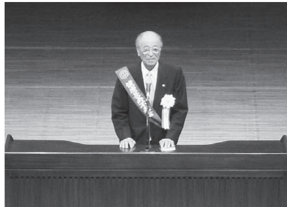
小田不老会理事長挨拶