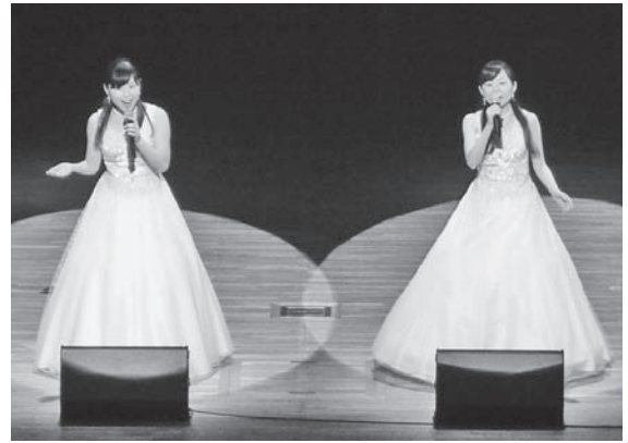
美しい歌声を響かせた坂入姉妹