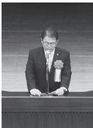
大村愛知県知事挨拶

久野庄太郎初代理事長と共に愛知用水工事に奔走し、不老会設立、その後の運営にも尽慮力された功績は甚大なもので感謝状を受ける